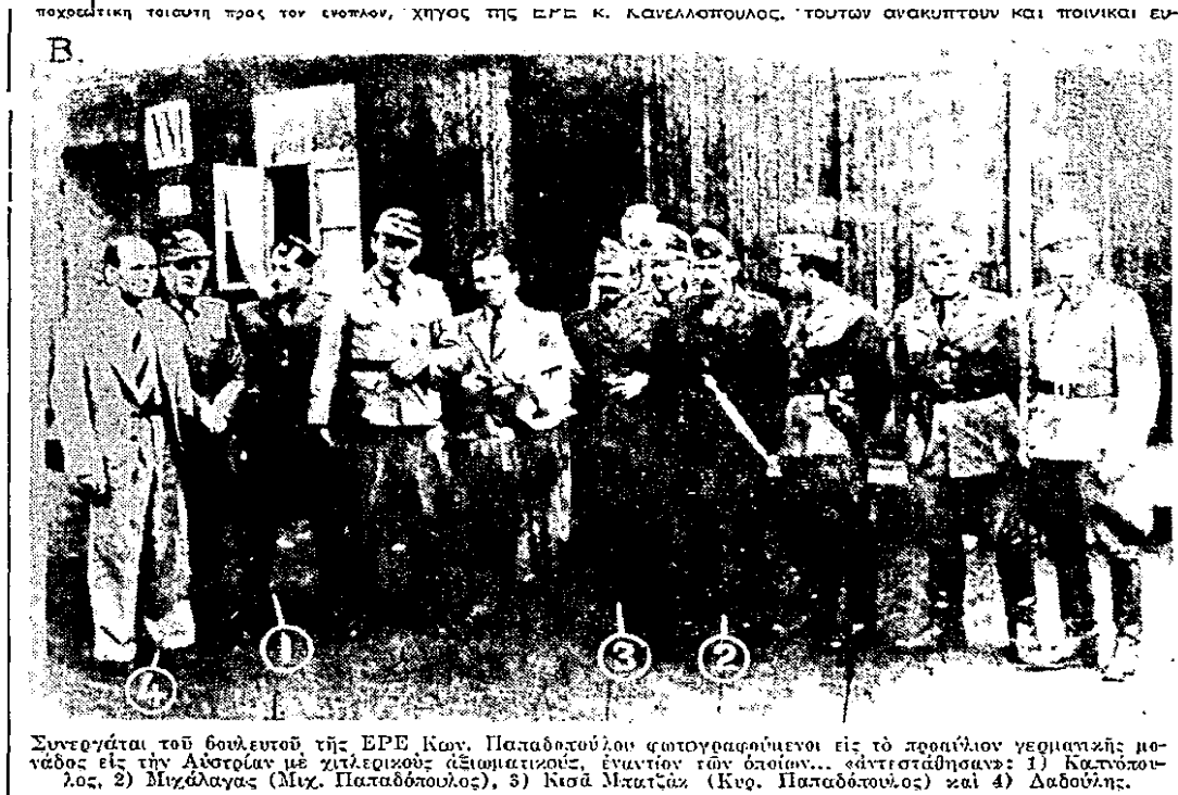
[φώτο και λεζάντα εφ. «Ελευθερία», 13/12/1964, σελ. 11]

Είς την δευτέραν είναι φωτογραφημένος με άλλους «οπληρχηγούς» της οργανώσεως ... αντιστάσεως «Εθνικός Ελληνικός Στρατός» και Γερμανούς αξιωματούχους έξω από γερμανικόν στρατώνα εις την Αυστρίαν.