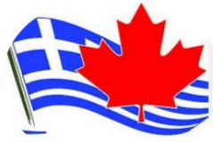
CANADIAN HELLENIC CONGRESS