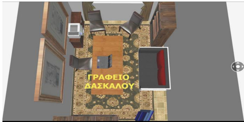
Ε. ΓΡΑΦΕΙΟ ΔΑΣΚΑΛΑΣ/ΟΥ (ανάγκες)