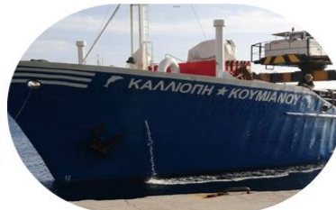
ΠΛΟΙΟΚΤΗΤΗΣ: Ντίνος & Χριστόδουλος Κουμανός ΠΛΟΙΑΡΧΟΣ: Χριστόδουλος Κουμανός