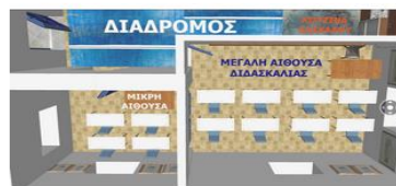
Ζ. ΔΥΟ ΑΙΘΟΥΣΕΣ ΔΙΔΑΣΚΑΛΙΑΣ (Ανάγκες)