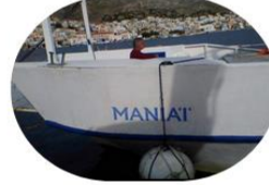
ΠΛΟΙΟΚΤΗΤΗΣ: Δημήτριος Μανιάς ΠΛΟΙΑΡΧΟΣ: Μανώλης Πετράκης