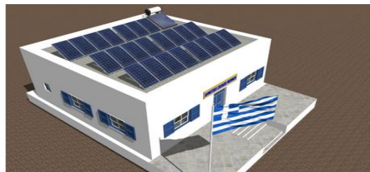
ΦΩΤΟΒΟΛΤΑΙΚΑ ΟΡΟΦΗΣ ΣΧΟΛΕΙΟΥ